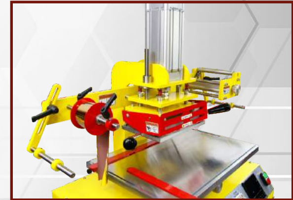
Założ ogranicznik sprężyny.