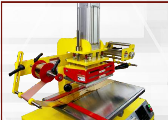
Przeprowadź folię pod matrycą.