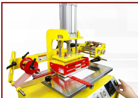
Wykonaj próbne odbicie.