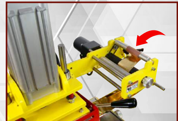
Zamocuj koniec folii w układzie przewijającym.