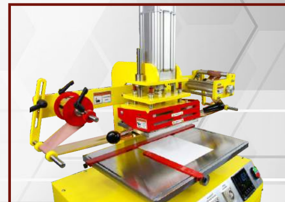
Wyreguluj czerwone szablony na stole roboczym aby zachować powtarzalność prac.