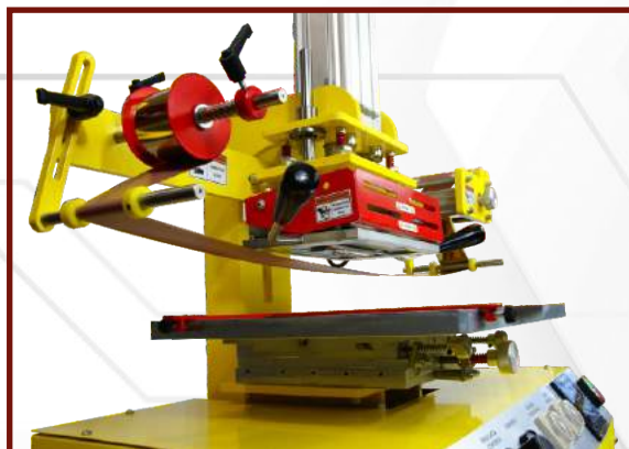
Prawidłowo przewleczona folia.