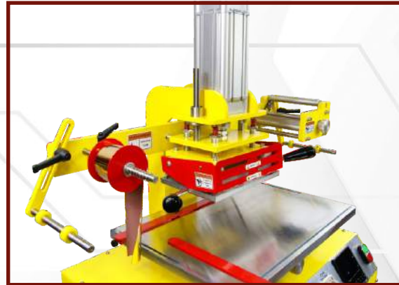
Założ sprężynę dociskającą.