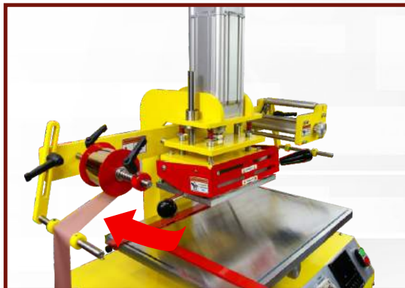
Przeprowadź folię przez lewą prowadnicę.