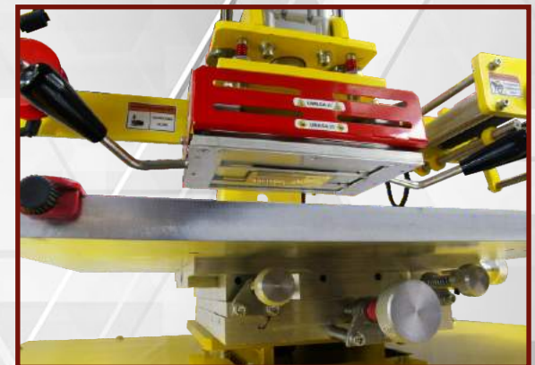
Zamknij osłonę bezpieczeństwa.