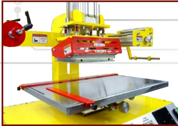
Unieś osłonę bezpieczeństwa.