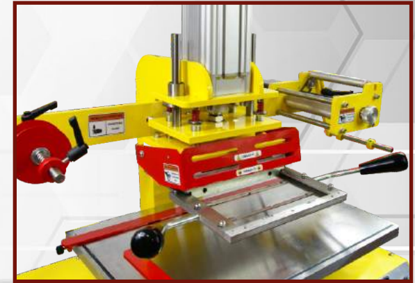
Zamontuj listwy do mocowania matrycy w odpowiedniej odległości od siebie.