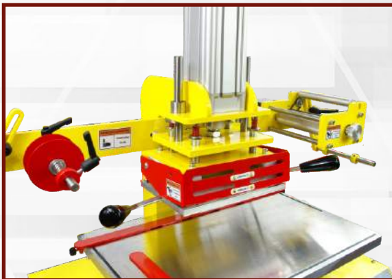
Wsuń ramkę wraz z matrycą pod płytę grzejną.