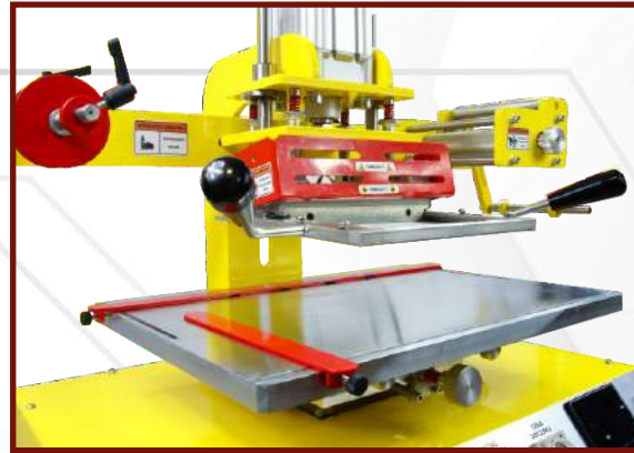
Wsuń ramkę do matrycy w prowadnicę płyty grzejnej.